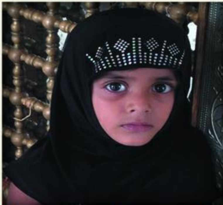
સૈયદા સકીના ઝહેરા અમદાવાદ. રોઝા ૨