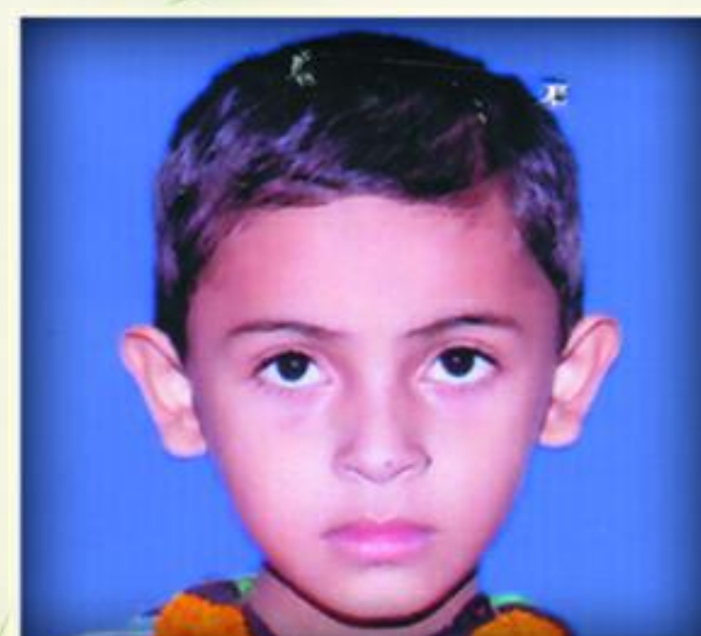
નર્ધમ અબ્બાસ રવાણી રાજુલા. રોઝા ૩૦